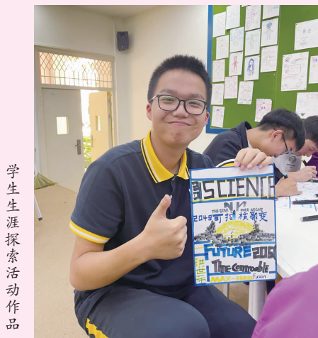
学生生涯探索活动作品