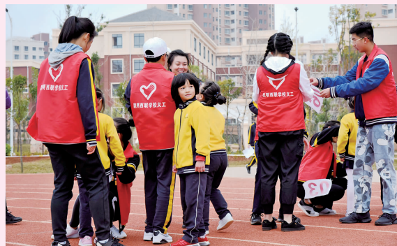
学校领导力课程—义工联