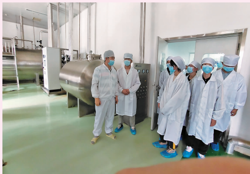
初中社会实践活动