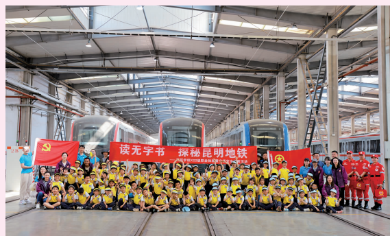
小学社会实践活动