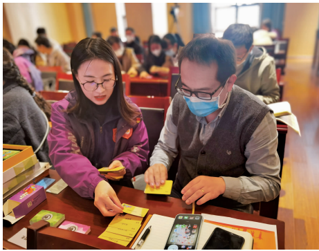
教师生涯教育培训