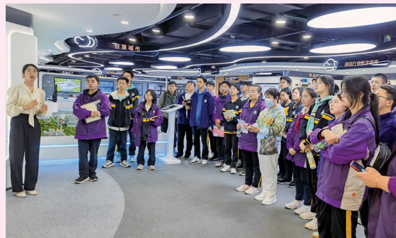
高中社会实践活动